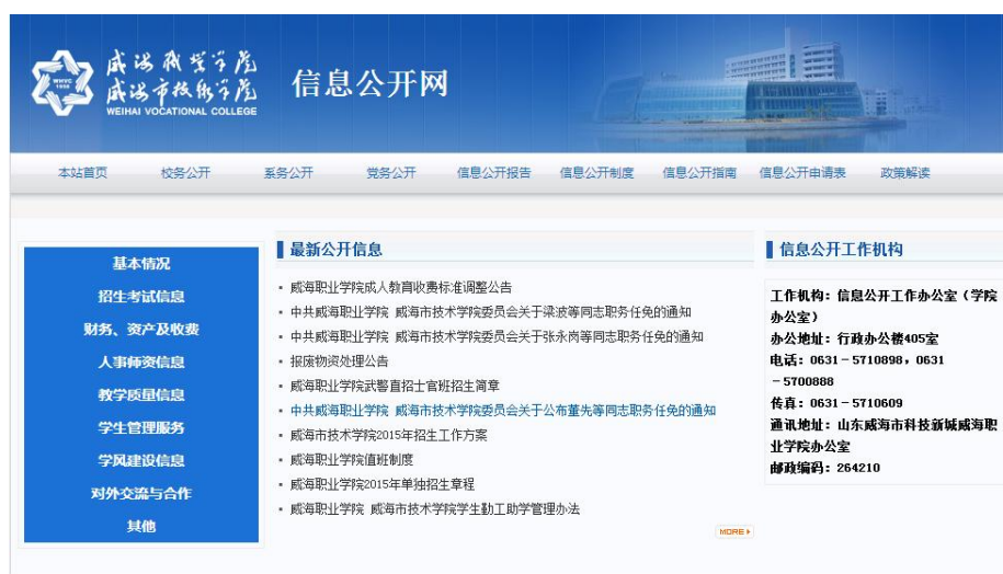
(威海职业学院信息公开网)

学院认真执行教育部《高等学校信息公开事项清单》（〔2014〕23号，以下简称《清单》）文件，根据文件要求，一方面建设学院信息公开网，设立“校务公开”、“系务公开”、“党务公开”专栏，增强管理透明度，另一方面对信息公开事项列出清单，发布《威海职业学院信息公开基本事项清单》《威海职业学院系部信息公开基本事项清单》，明确了学院各部门信息公开的职责范围，使学院的重大事项及涉及教职员工和学生切身利益的事项得到及时有效公开。